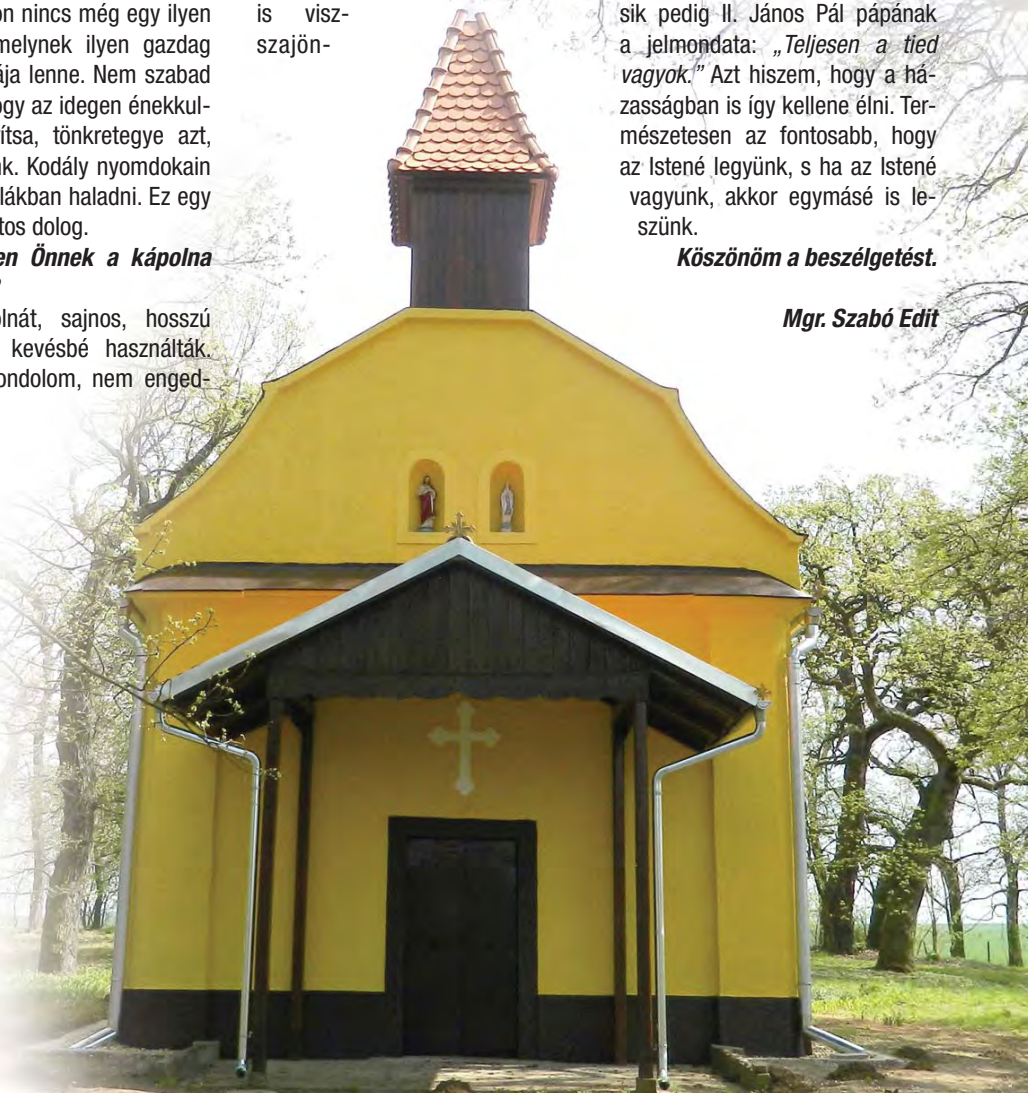
A felújított kápolna